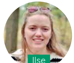
Ilse @ zusterilse